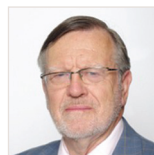
AUTEUR Jean-Marie Breton TITRE Professeur émérite de droit public, université des Antilles (Guadeloupe), membre du comité de rédaction, Juris tourisme

Ses codirecteurs souhaitent qu'il fasse l'objet d'une large diffusion, dans l'espace francophone, mais également au-delà de celui-ci, afin de contribuer utilement et efficacement à une meilleure connaissance et à une pratique optimale du tourisme, ainsi qu'à la nécessaire réflexion sur son évolution et son devenir. ■